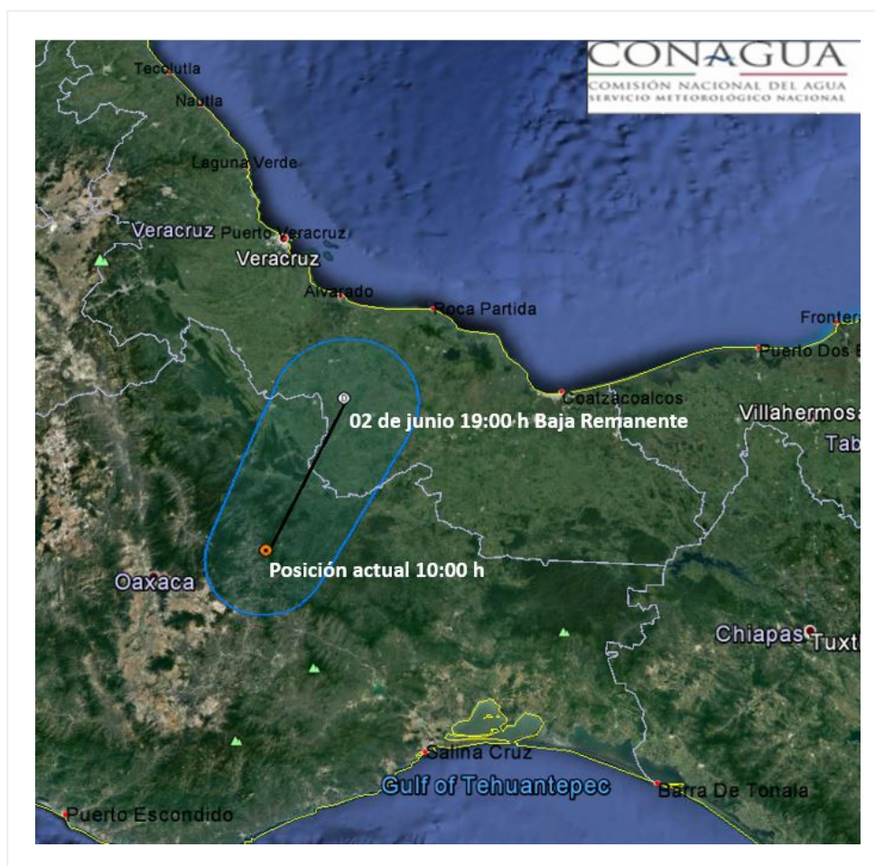
Trayectoria pronóstico de la Baja Presión Remanente de "Beatriz"